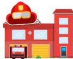
estación de bomberos: fire station