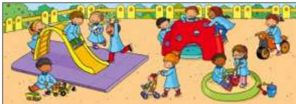
playground (patio de juegos)