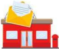
oficina de correos: post office