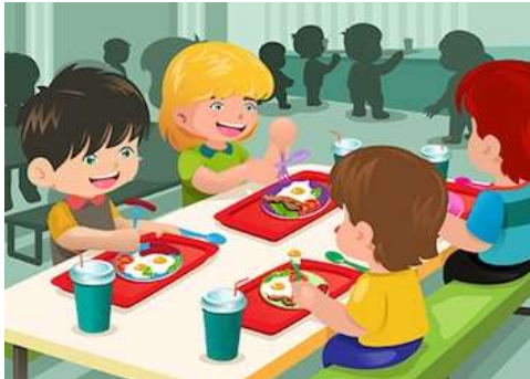
Dining Room (Casino)