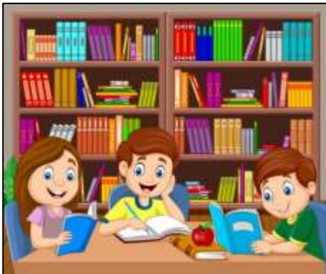
library ( biblioteca)